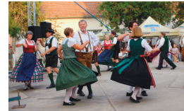
Volkstanzgruppen Arge Steiermark