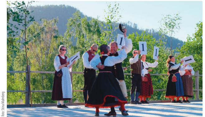
Domarna har efter en lång dag nått ett resultat.